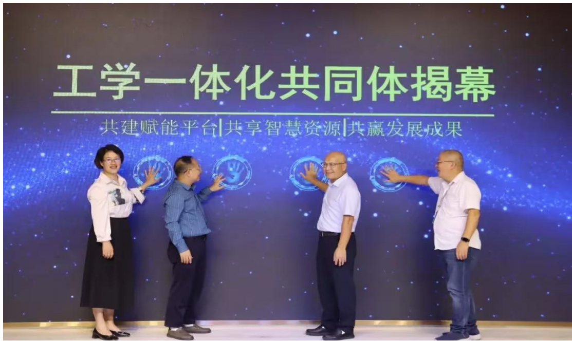
成立工学一体共同体